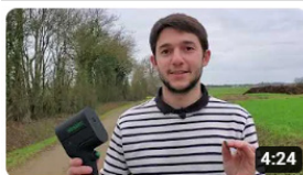
TUTO Utilisation du scanner - réalisé par Vertal