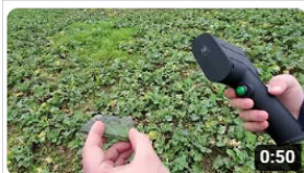
Mesure sur feuille de colza

Rendez vous sur YouTube pour visionner les tutos ! @senseen9611