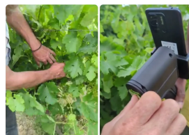
choix du rameau de vigne